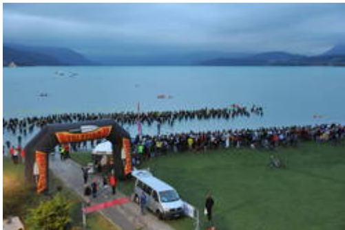
Schwimmstart um 6:30 morgens bei Morgendämmerung

Es handelt sich um einen Punkt zu Punkt Wettkampf bei dem keine Strecke zweimal befahren wird. Der Schwimmeinstieg befindet sich im Seebad Thun (Thunersee) und endet nach 155km mit dem Berglauf am Schilthorn, ein ehemaliger Schauplatz eines James Bond 007 Films, auf 2970 m.