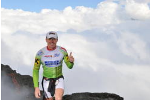
3000m und über den Wolken kurz vor dem Ziel