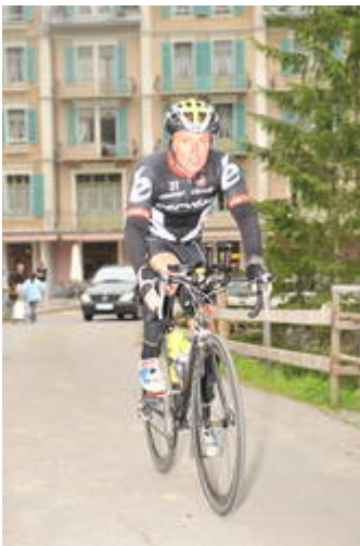
Mit dem Fahrrad auf die große Scheidegg (1970m ü.M.) durch den kleinsten Ort der Schweiz „Rosenlauri“.

Zuerst eine solide Grundlage beim Laufen und Radfahren aufbauen und dann Kraftausdauer in beiden Disziplinen soviel es geht. Fahrtspiel sollte man ebenfalls trainieren, da der Puls durch die langen Anstiege oft sehr lange im hohen Bereich (140-160) ist und dann auf der Abfahrt tief ist. Leider sind bei uns die alpinen MTB Möglichkeiten beschränkt, sodaß wir als Burgenländer eher Nachteile haben. Die Rennradabfahrten waren naß, sehr unangenehm und gefährlich zu fahren durch die engen Kurven, Steilheit und hohen Geschwindigkeiten. Mein Schwimmtraining war nur ca. 2-4 km/Woche war aber völlig ausreichend um nach 55 min an Land gespült zu werden.