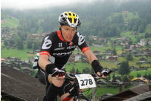
Mit dem MTB auf die kleine Scheidegg (2050m ü.M)